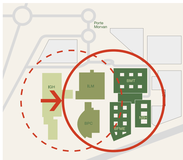
Nouvelle centralité et polybloc organisé autour d'un cœur d'îlot

Connecté à l'Institut Louis Mathieu et au Bâtiment Philippe Canton, « l'îlot central » constitue une pièce essentielle du redéploiement du nouvel hôpital. Pierre angulaire du projet, cette centralité assure pour l'ensemble du site accessibilité, connexions et mutualisation des espaces grâce au grand hall partagé , à la confluence de trois plots. Ce nouveau cadre est appelé à transformer la relation entre personnel soignant et patients pour le meilleur confort de tous. Il participera également au renouvellement de l'image hospitalière avec la construction d'un vaste ensemble s'inscrivant dans la trame du bâti existant dans une situation mêlant insularité et proximité.